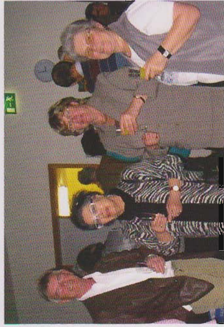
Helfer mit Gästen